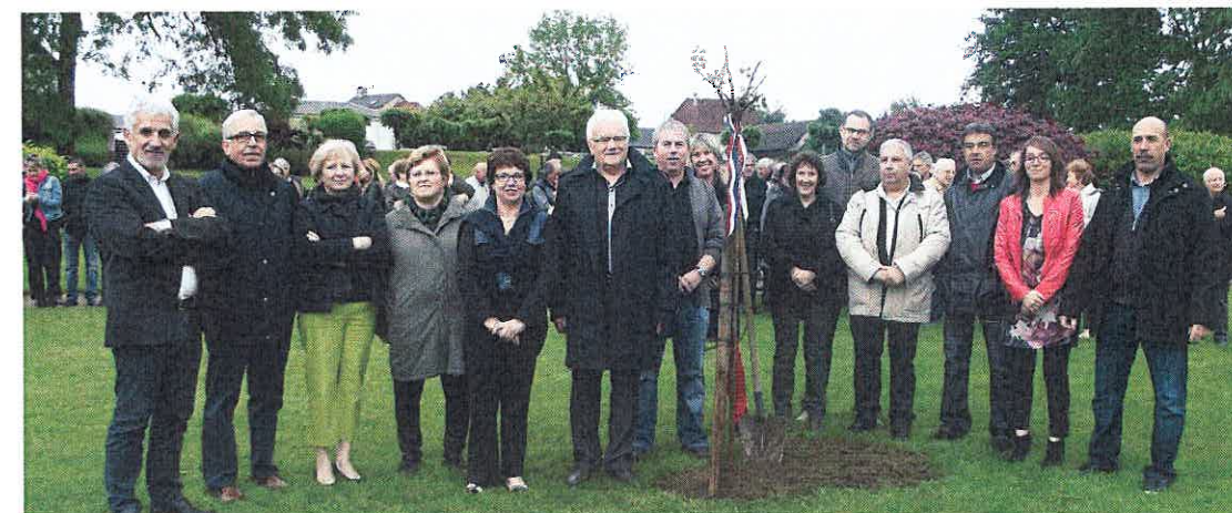
Un moment de partage bien apprécié par tous !

Auparavant Monsieur le Maire a présenté tout le conseil municipal en place et a salué le civisme des habitants de Saint-Mexant qui ont participé à 85% à ce scrutin.