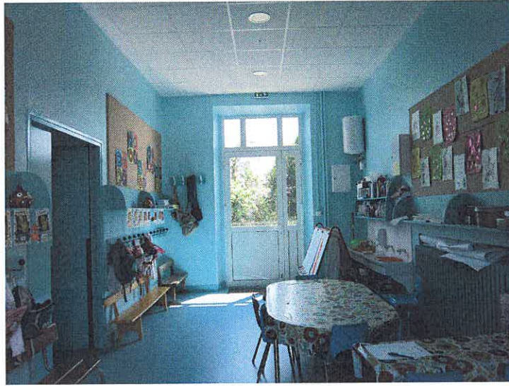
Entrée classe maternelle