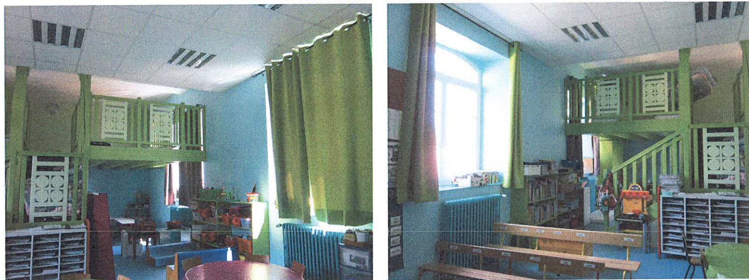
Classe maternelle avec sa mezzanine colorée