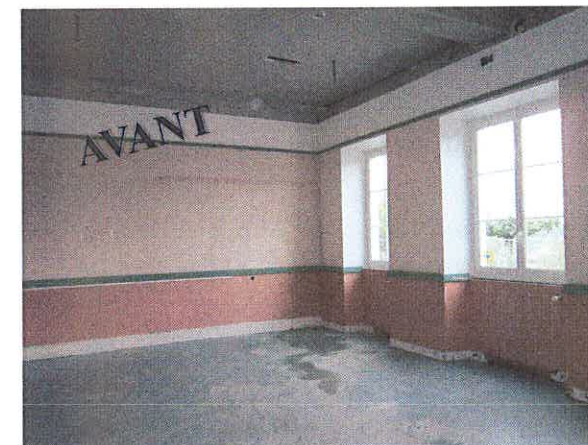
Classe de Mme MILLOT

Cette importante réfection s'est étalée de la période des vacances de Toussaint à celle de Pâques. Elèves, enseignantes et personnel communal ont su s'adapter aux déménagements provisoires engendrés par cette rénovation. Ils ont tous été satisfaits de regagner leurs classes respectives, joliment rénovées ou agrandie pour l'une d'entre elles.