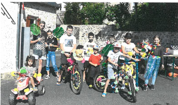
Le concours des vélos fleuris organisé par l'atelier loisirs créatifs

Pour tous renseignements vous pouvez appeler Danie au 06.89.89.04.60